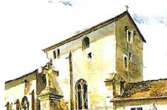
Eglise de Champoungny

► A Champoungny, église fortifiée, chapelle Notre-Dame des Affligés